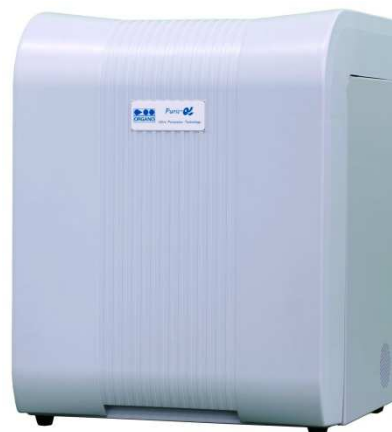
超純水装置 ピューリック-α