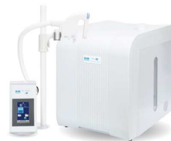
超純水装置 ピューリックUP-α