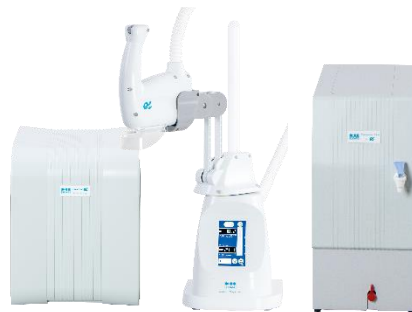
ピュアライト PR-α(アルファ)