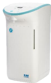
ピューリック μ(ミュー)