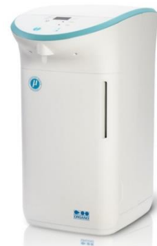
超純水装置 ピュールックμ

※AGSOR、FIBAX、オルトピアJクラウド、オルローター、ピュールックはオルガノ(株)の登録商標です